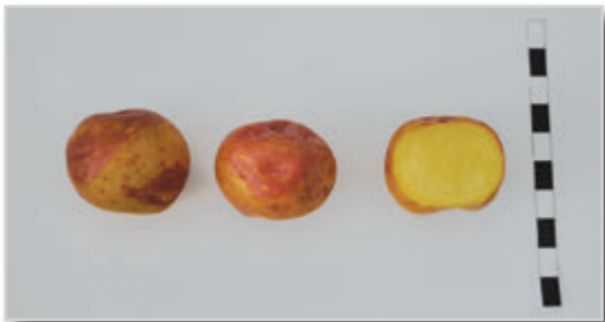
Foto42: DE EVARISTO (Cultivada en Lanzarote)