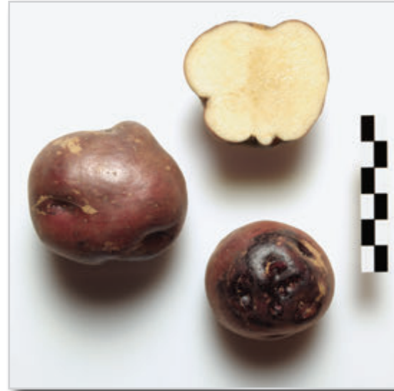
Foto19: Papa Azucena Negra.

Las papas de esta variedad son generalmente de forma redonda, con la piel algo áspera. El color de la piel es morado-rojiza, salpicados de marrón claro como color secundario por todo el tubérculo. La carne es color crema, con los ojos superficiales y los brotes o “grelos” violetas con manchas blancas. Es una papa muy dura, que llega a estar más de 4 meses sin brotar o “grelarse”, estando buena para comer hasta enero o febrero del año siguiente si se cogió en junio-julio. Esta papa ha sido la preferida para la elaboración del condumio en algunas zonas del norte de Tenerife.