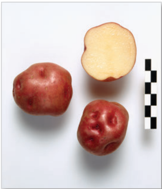
Foto34: PALMERA COLORADA (Cultivada en Tenerife. En la Palma se le conoce con el nombre de Colorada o Marciala)