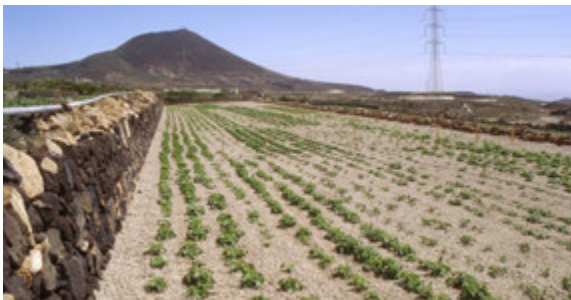
Foto8: Cultivo en jable en San Miguel

agostera por la fecha de siembra en que se realiza, similar a la de Vilaflor. En esta época además de variedades blancas como la Cara, Red Cara y King Edward, también se plantan variedades locales de corto periodo de brotación, lo que permite su plantación hasta dos veces al año, como son las Negras y Palmeras. Hoy en día la mayor parte de estos cultivos se encuentran mecanizados, utilizando sembradoras y cosechadoras que han sido localmente diseñadas.