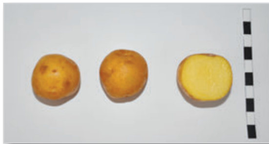
Foto36: DE MARIA