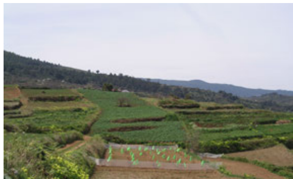
Foto13: Cultivo de papas y cereales en Icod el Alto.