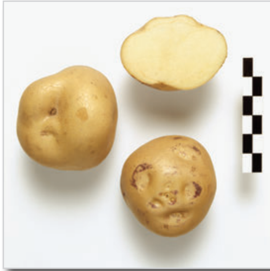
Foto20: Papa Azucena Blanca.