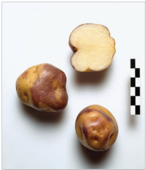
Foto32: PALMERA NEGRA (Cultivada en Tenerife. En la Palma se le conoce con el nombre de Negra o Marciala Negra)