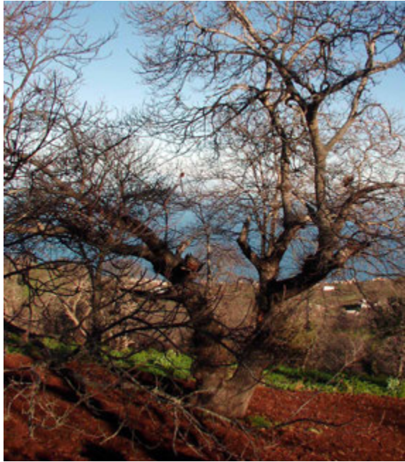
Foto11: Huerta con castaño preparada para sembrar papa.

○ La zona Central , donde se ubican las grandes superficies productoras de papa del entorno de Benijos, Palo Blanco y Las Llanadas. Quizás sea, junto con la de Icod el Alto, la zona cuantitativamente más importante en la producción de papas antiguas. Principalmente se cultivan el grupo de las Bonitas, siguiéndole las Coloradas y Venezolanas. En esta zona los agricultores viven principalmente del cultivo de la papa, conviviendo variedades tradicionales con grandes extensiones de papas comerciales, fundamentalmente Cara y Red Cara, aunque en los últimos años han aparecido variedades nuevas como la Druid, Valor, Slaney, Rooster, etc.