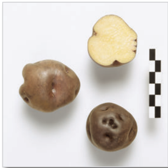
Foto22: Papa Bonita Negra.