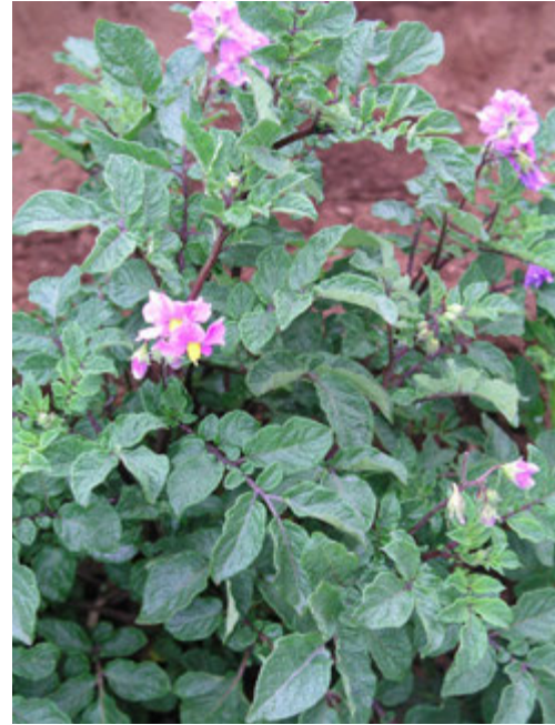
Foto7: Planta de la variedad Colorada de Baga