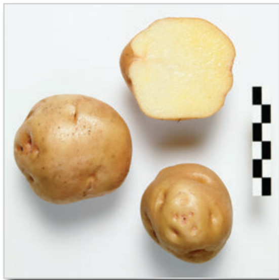
Foto25: Papa Borralla o Melonera.

Los tubérculos de esta variedad son oblongos si se mira en una posición y aplanados si se mira por el otro, siendo redondos cuando las papas son pequeñas. Los ojos son ligeramente profundos, con la carne amarilla y los grelos de color rosado con pocas manchas a lo largo y en el ápice. El color de la piel es marrón claro con ligeros tonos anaranjados, y ligeramente salpicado de rosado, sobre todo en la zona de los ojos. Es una papa con un periodo hasta la brotación largo, y con alto contenido en materia seca, de tal manera que dicen que cuando se come con un guiso de carne o en salmorejo se “chupa” toda la salsa. Se le conoce como Borralla en Anaga y Melonera en Teno. Existe una variante conocida como Borralla Rosada.