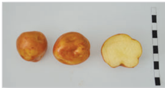
Foto35: BORRALLA COLORADA