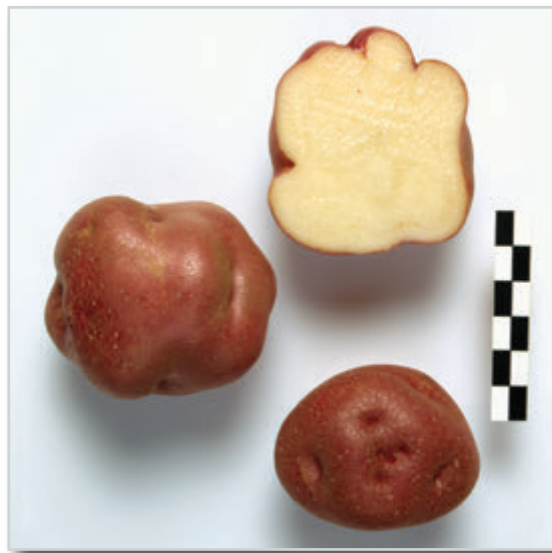
Foto26: Papa Colorada de Baga.