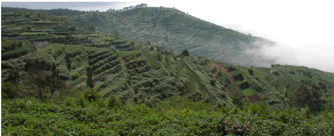
Foto16: Cultivo en bancales en el norte de Tenerife.

■ Otras zonas dispersas: Existen diversos reductos aislados donde se cultivan papas en Tenerife, y que sería muy difícil de enumerar sin olvidar alguno. Pero casi podríamos decir que cada municipio tinerfeño tiene su tradición papera. Valga como ejemplo la im-