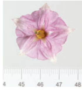
Foto6: Flor de la papa Negra Yema de Huevo