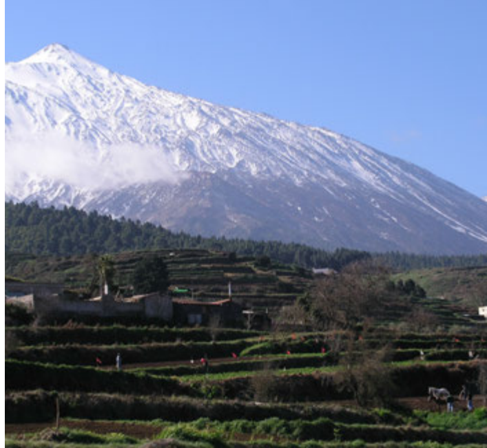
Foto12: Zonas de cultivo en Icod el Alto.

El Teide de forma majestuosa preside en esta comarca agrícola los cultivos de papas en rotación con cereales y granos, fundamentalmente chochos o altramuces. Es una de las zonas por excelencia de las papas antiguas, tanto por antigüedad en el cultivo (Bandini, 1816), como por la calidad de las papas aquí cultivadas. Las variedades principales son las Bonitas, Azucenas, Coloradas, Venezolanas, y ocasionalmente otras como la Del Riñón o la De María. Tradicionalmente las zonas altas han sido productoras de semilla para el resto de las comarcas papeiras de la isla, a ellas iban los agricultores de otras comarcas a comprar la semilla. Es un paisaje que recuerda en cierta manera a las zonas productoras andinas. Las plantaciones son generalmente de enero a febrero, y en ocasiones se realizan plantaciones tardías después del verano.