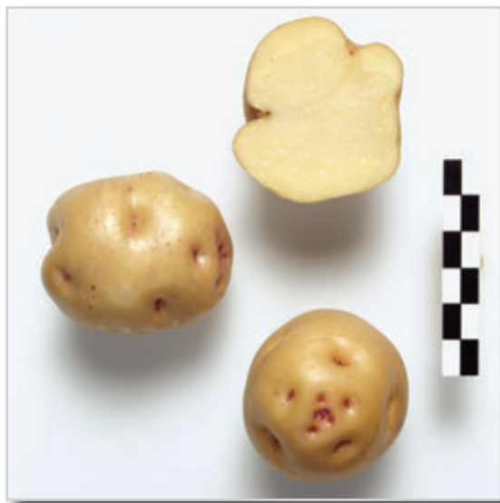
Foto21: Papa Bonita Blanca.

Las papas de la Bonita Blanca o Marrueca son de color canelo claro con muy pocas manchas morado-rojizo claras, principalmente en la parte de arriba del tubérculo, en cejas y ojos. La textura de la piel es intermedia, es decir, ni muy áspera ni muy suave. La carne es amarillo claro. Los ojos son ligeramente profundos, y la forma es predominantemente redonda, aunque en algunas ocasiones aparecen tubérculos comprimidos, e incluso algo oblongos. Los “grelos” son morados con la punta de color blanco. Esta papa dura aproximadamente unos cuatro meses sin grelarse, algo menos que las azucenas, pero presentando en general una buena conservación.