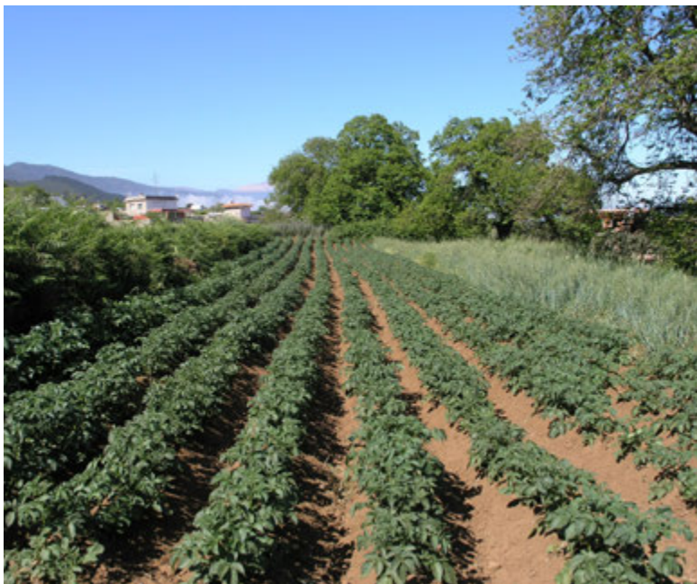
Foto4: Cultivos de papas y cereales asociados en Tenerife