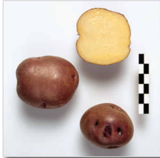
Foto29: Papa Peluca Negra.

Similar a la anterior, pues pertenece al mismo grupo, varía fundamentalmente en el color de la piel del tubérculo que es morado rojizo muy oscuro con muy pocas manchas anaranjadas. Los “grelos” son morados oscuros con el ápice blanco. Tiene las mismas características de postcocecha que la Peluca Blanca. Existe una Peluca intermedia entre la Peluca Blanca y la Peluca Negra, que es la conocida como Peluca Rosada.