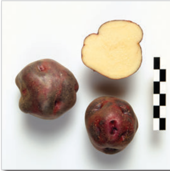
Foto30: Papa Torrenta o Terrenta.