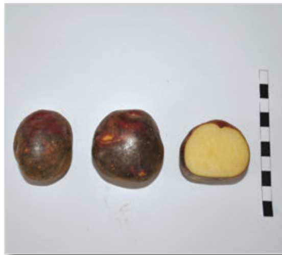
Foto43: NEGRITA (Cultivada en el Hierro y similar a la Tormenta o Tormenta que se cultiva en Tenerife)