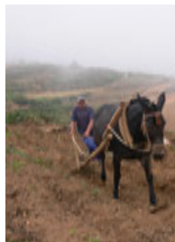
Foto15: Recolectando papas

■ Desde Icod de los Vinos hasta El Tanque: Aquí nos encontramos con una enorme riqueza varietal, en Las Abiertas, La Vega, San José de los Llanos, La Juncia, El Tanque, etc. Se trata de núcleos bien delimitados en los que se plantan papas en pequeñas parcelas según sistemas de cultivo casi artesanales, donde se mezclan las mismas variedades antiguas que en la zona anterior con las variedades de origen sudamericano de introducción más reciente, fundamentalmente venezolano, que han traído los emigrantes retornados. En esta zona varían mucho la forma de cultivo y las fechas de plantación, pues abarca numerosas altitudes, con muchos nichos agroecológicos. También tiene cierta importancia la parte del municipio de Santiago del Teide dedicado al cultivo de papas.