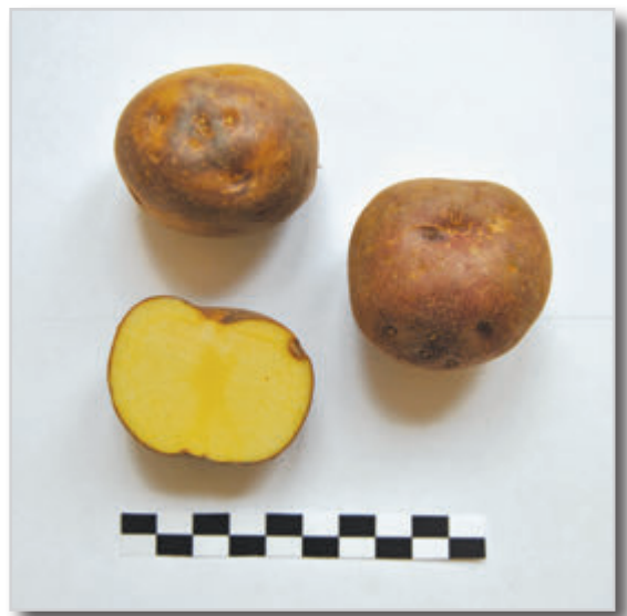
Foto31: Papa Venezuela Negra.

ZONA DE PRODUCCIÓN: Es una de las papas más distribuidas por toda la isla, sembrándose incluso en algunas zonas del sur.