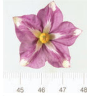
Foto5: Flor de la papa Azucena Blanca

Las papas no son el fruto de la planta, son tallos subterráneos engrosados por la acumulación de almidón que tienen la capacidad de producir nuevas plantas. Esto explica el que se verdeen al exponerlos a la luz como lo hacen los tallos de cualquier planta.