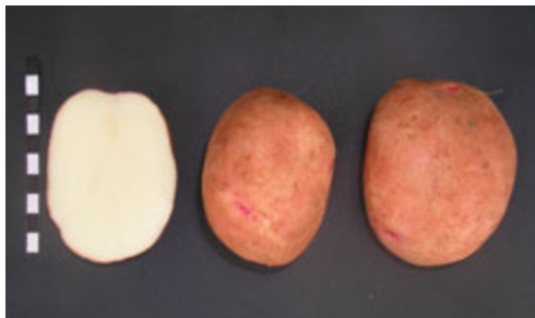
Foto3: Variedad Comercial Druid