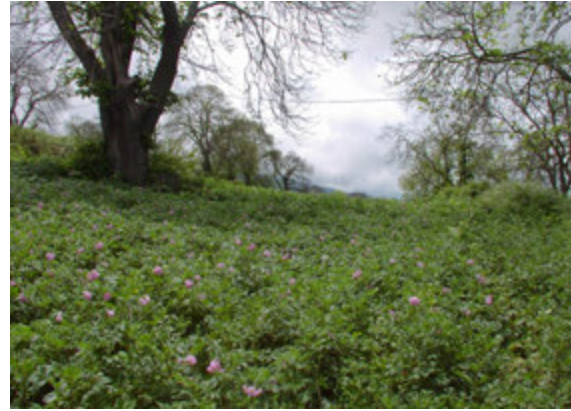
Foto10: Asociación entre el castaño y la papa en la Matanza

○ La ladera este del Valle, con Mamio, Pinolere y Aguamansa, conforman en cierta manera un paisaje muy similar al de Tacoronte-Acentejo, donde se cul-