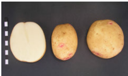
Foto2: Variedad Comercial Cara