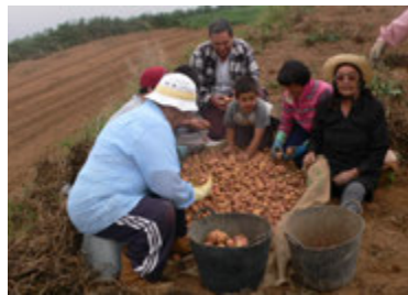
Foto14: Seleccionando la papa para la semilla.