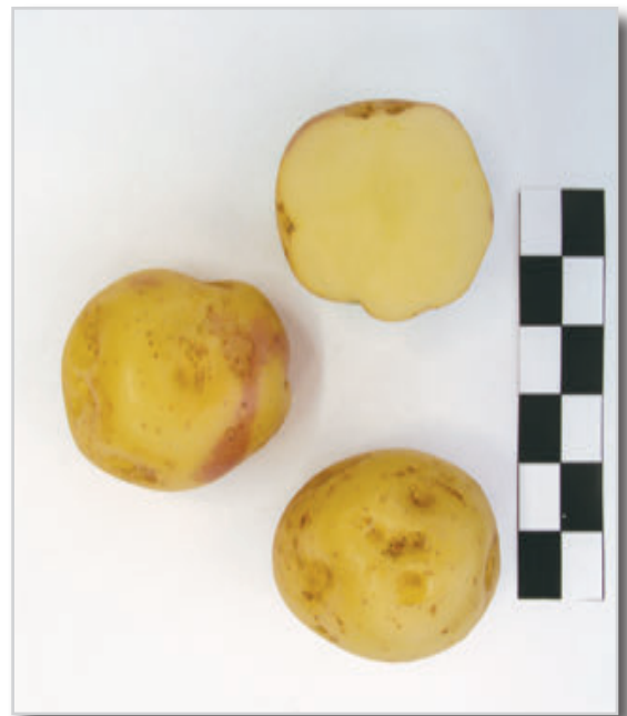
Foto33: PALMERA BLANCA (Cultivada en Tenerife. En la Palma se le conoce con el nombre de Buena Moza, Marciala Blanca o Forastera)