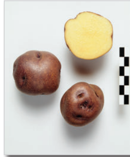
Foto27: Papa Negra o Yema de Huevo

Las papas de esta variedad presentan como característica más importante el color amarillo intenso de la carne, que las hace realmente muy atractivas. La piel es morada rojiza muy oscura, casi negra, con manchas color marrón anaranjado. Se ha encontrado una alta variabilidad en la cantidad de manchas y su distribución. Así, por ejemplo, en la variedad Negra Oro de CULTESA (variedad negra yema de huevo saneada, es decir, desprovista de virus) predomina el color anaranjado con manchas morado-rojizas, esto suele producirse también de forma espontánea en campo. Algunos agricultores llaman a estas papas de color claro que aparecen en la cosecha como Blanca Negra, y parece que dependen de las condiciones de estrés a las que ha estado sometido el cultivo. Los ojos son ligeramente profundos, aunque al aumentar los tubérculos los ojos son mucho más profundos. La forma de la papa es redonda principalmente en los tubérculos más pequeños, oval en los intermedios e incluso alargados en aquellos de gran tamaño. Al brotar los grelos son violetas con manchas de color blancas. Las Papas Negras son una exquisitez y una rareza que nos han dejado los agricultores tinerfeños. Con un toque cremoso al cocinarlas, no son tan harinosas como el resto de las variedades antiguas. Su gran inconveniente es su corto periodo de brotación (entre 15 y 45 días), lo que las convierte en un producto de primor, pues se estropean rápidamente tras su cosecha.