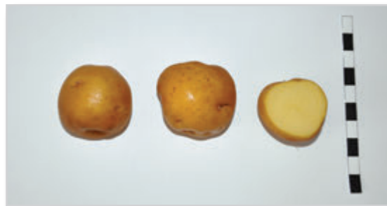
Foto39: DEL RIÑÓN