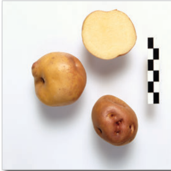
Foto28: Papa Peluca Blanca.