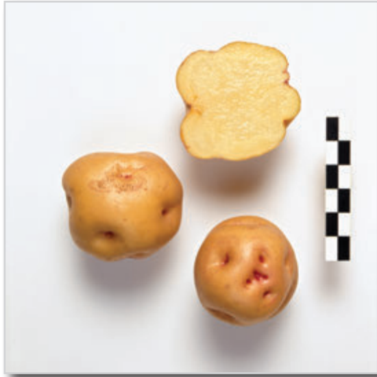
Foto24: Papa Bonita Ojo de Perdiz.