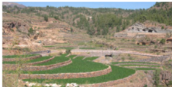
Foto9: Cultivo en jable en Vilaflor

■ Vilaflor: es por excelencia la zona de cultivo más alta de la isla, y probablemente de España, ya que los cultivos llegan a los 1600 msnm. El cultivo es muy parecido al de la zona baja, salvo por varios factores. En primer lugar las fechas de siembra son tardías, habitualmente entre el 15 de julio y el 15 de agosto, dependiendo de la altura y el lugar. En segundo lugar se usa semilla de papas blancas comerciales de segunda multiplicación, es decir, los agricultores no compran la semilla sino que la deben obtener en la cosecha temprana en cotas bajas o antiguamente en la zona norte