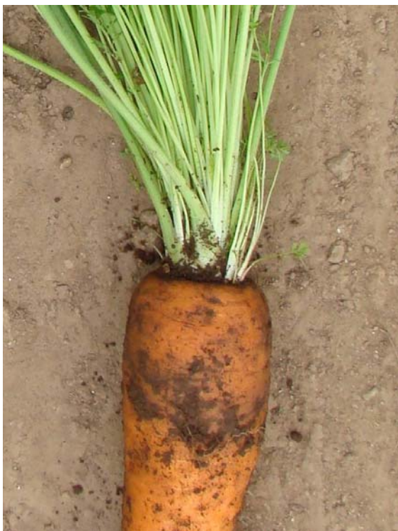
Foto 5.- Multibrotaciones