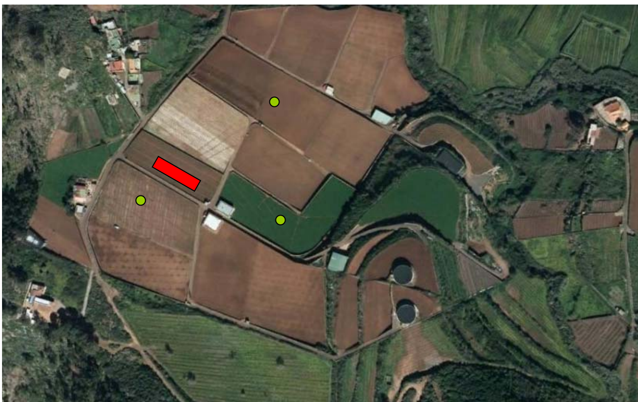
Foto 2.- Vista aérea de la zona de cultivo. En rojo, situación del ensayo; y en verde, la localización de las parcelas cultivadas de zanahorias durante el ensayo.

El ensayo se desarrolló en una finca situada en la Padilla Baja en el Término Municipal de Tegueste dedicada al cultivo de la zanahoria.