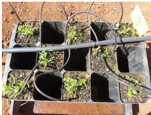
Foto 4.- Bandeja con los 8 alvéolos y las zanahorias.

Se instaló un gotero tipo microtubo por alvéolo con un caudal de 4 l/h. Se regó 3 veces por semana en días alternos durante 10 minutos.