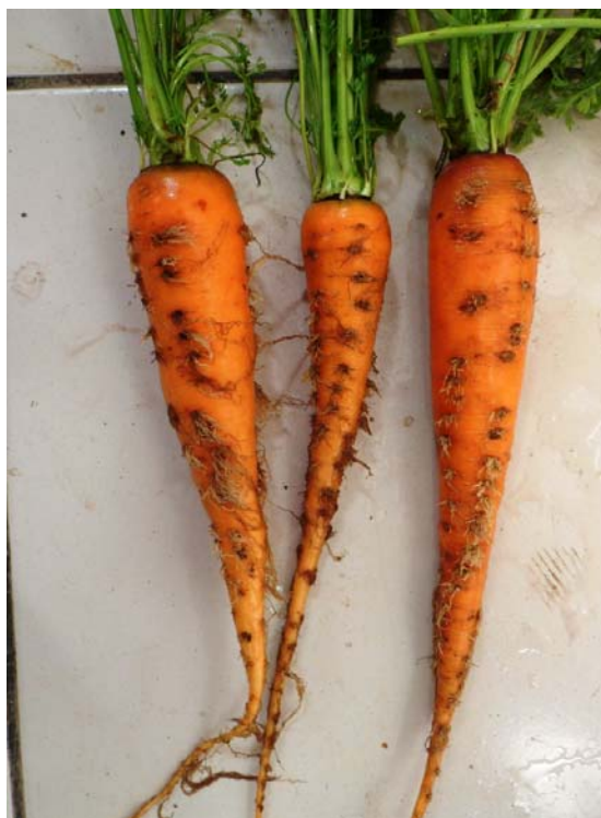
Foto 6.- Emisión abundante de raicillas