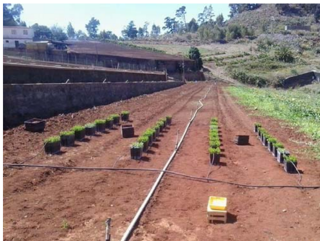
Foto 3.- Vista general de las bandejas en campo.

Las bandejas se colocaron en campo próximas a parcelas de cultivo de zanahorias con amarillos típicos de 'Ca. L. solanacearum'. Se situaron a una distancia de 2 m entre bloques (orientación norte-sur) y con una separación de 1 m entre las bandejas de cada bloque (orientación este-oeste).