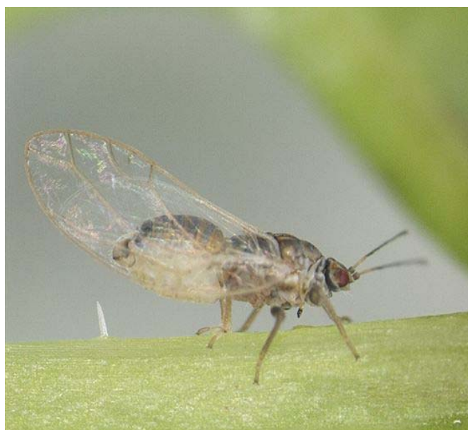
Foto 1.- Hembra de Bactericera trigonica .