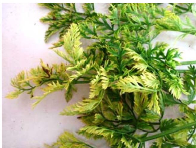
Foto 7.- Amarilleo