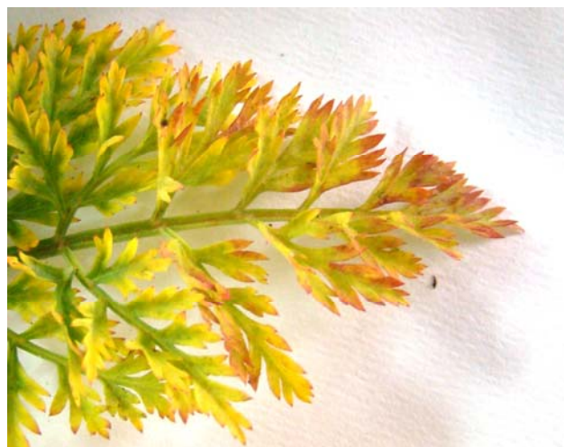
Foto 8.- Enrojecimiento